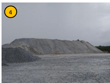
ลานเก็บกองแร่