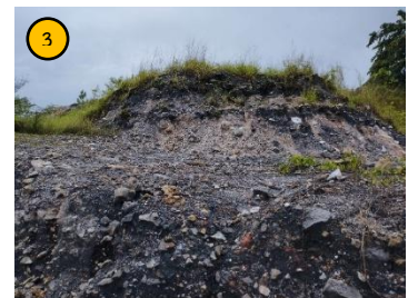
กองเปลือกดิน