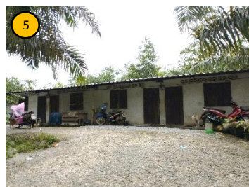
บ้านพักพนักงาน