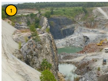
พื้นที่หน้าเหมือง