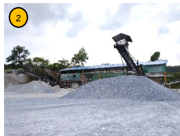
โรงแต่งแร่ของโครงการ