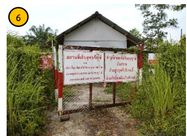
อาคารเก็บวัดถูระเบิด